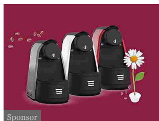
Sponsor Un caffè in capsule che