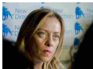
Meloni contro Vauro: "Vignetta