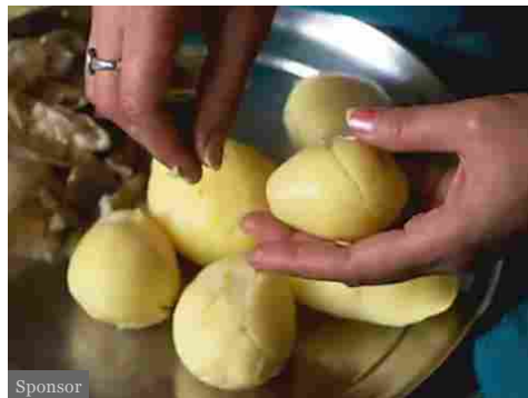
Sponsor Intestino: dimentica i probiotici e piuttosto fai questo. (Nutrivia)