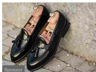
Sponsor Velasca. Scarpe artigianali, fatte