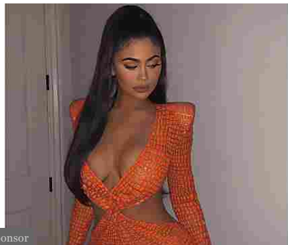
Sponsor Celebrity senza vergogna! Oltre 50 abiti che hanno fatto scandalo e perché (Amica)